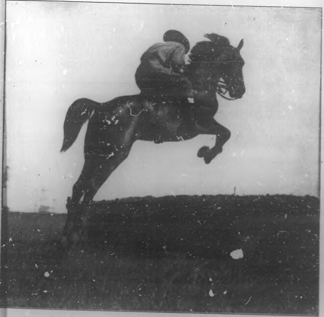
EL SALTO DE LA BANQUETA

En la hermosa fiesta celebrada en Columbia con motivo de la repartición de premios a los alumnos de la Escuela de Aplicación se realizaron arriesgados y brillantes ejercicios que fueron muy del agrado de la concurrencia que asistió al acto. Entre esos ejercicios figuró el del "salto de la banqueta", que es el que reproduce fielmente el grabado que aparece en esta plana. Los demás números fueron también muy aplaudidos y celebrados por la concurrencia, entre la que se destacaban el Hon. Presidente de la República, Sr. Alfredo Zayas, el Secretario de Guerra y Marina, Gral. Arnando Montes; el Secretario de Justicia, Dr. Erasmos Regleiferos; el Jefe del Estado Mayor del Ejército, Gral. Alberto Herrera, y una selecta representación de todas nuestras clases sociales. La fiesta obtuvo un éxito brillante y rotundo del que pueden sentirse muy satisfechos los profesores y alumnos de la Escuela de Aplicación.