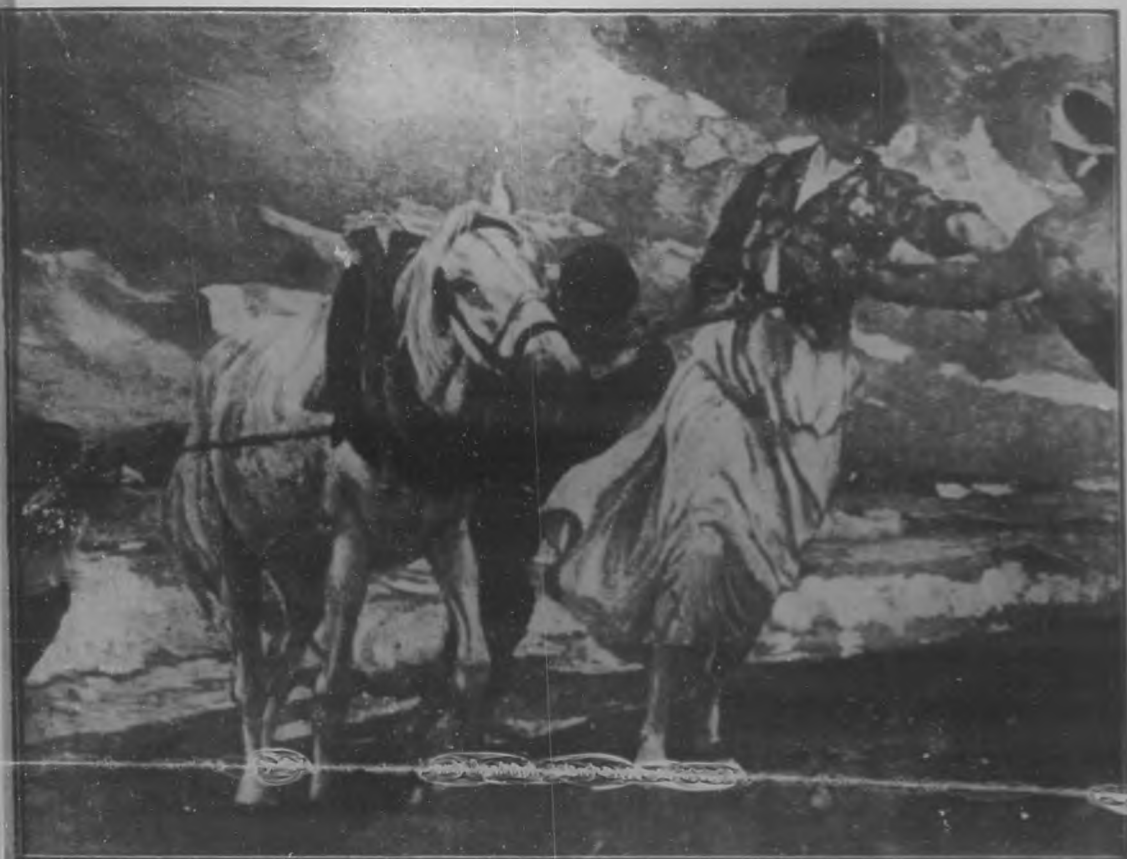
EN LA PLAYA